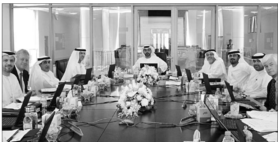
المكتبات واسترجاع البيانات وتقوم جامعة خليفة بإدارة مشروع شبكة عنكبوت وتمويل مشترك من قبل صندوق قطاع الاتصالات وجامعة خليفة.