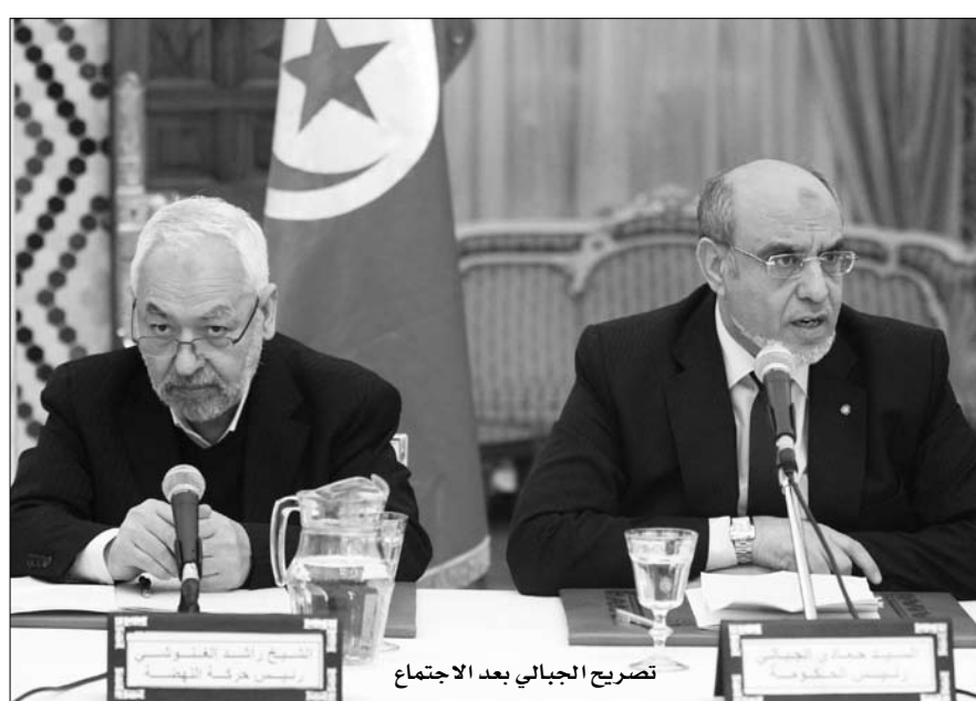
تصريح الجبالي بعد الاجتماع

مجلس أمناء الجبهة الشعبية عن دعوة الجبهة الشعبية عن طريق البريد الإلكتروني ودون سابق لثناء أو تشاور في الوقت الذي قامت فيه رئاسة الحكومة باللقاء مع قيادات أحزاب وطنية أخرى والتشاور معها مسبقاً استخفاً بشروط الحد الأدنى لمستلزمات الحوار والتشاور ومحاولة لوضع الجبهة أمام الأمر الواقع المفّر سلفاً خاصة بعد تشكيل ما يسمى ب مجلس الحكماء والبدء في تسريب أسماء بعض الوزراء للإعلام وفق نص البيان.